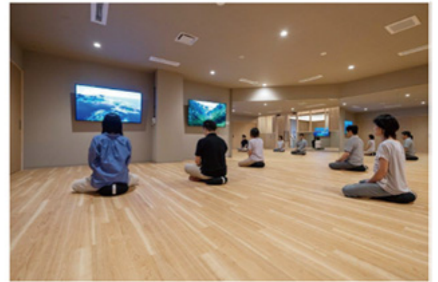
スタジオスタジオ