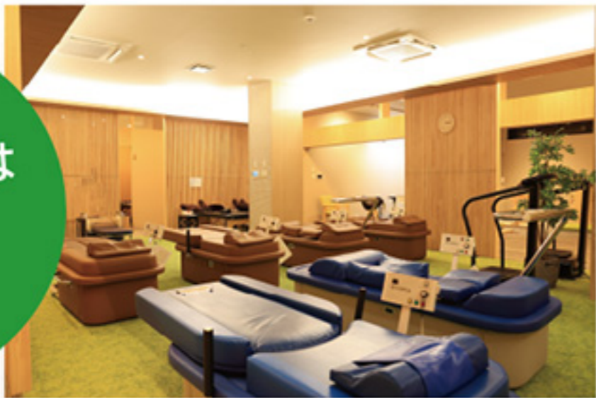
ととのえコーナー