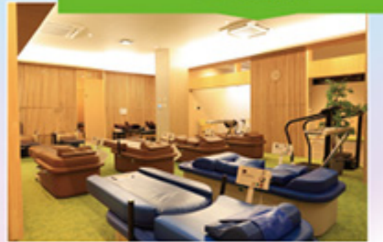
ととのえコーナー